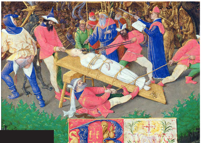
Tavlan hänger idag på Musée Condé, Chantilly i Frankrike.

1400-tal: De medeltida mysteriespelen innehöll ofta berättelser från Bibeln – varför då?