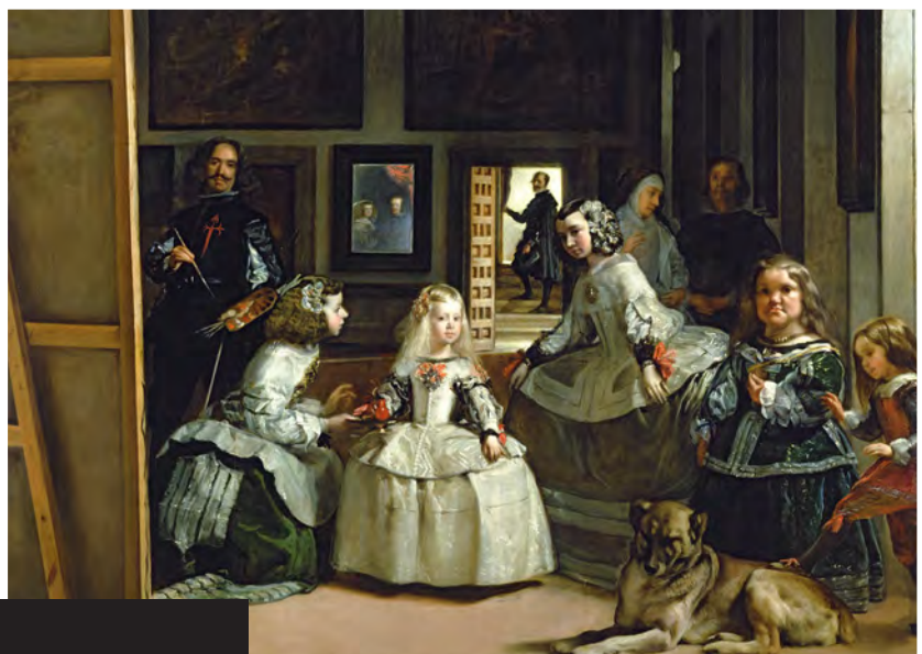
Tavlan hänger idag på Pradomuseet i Madrid.

1600-tal: Hur kom det sig att Spanien var ett så stort land under perioden?