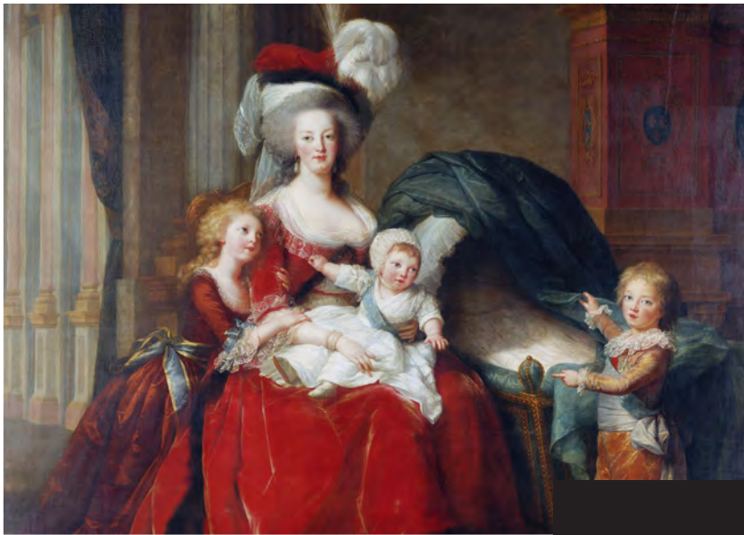
Tavlan hänger idag på Musée national des châteaux de Versailles et de Trianon i Versailles utanför Paris.

Revolutionen är på väg. Marie-Antoinette har blivit otroligt impopulär. På gatorna delar folk ut flygblad med budskapet att "den österrikiska skökan" måste elimineras. Konstnären Elisabeth Vigée-Le Brun försöker med sin tavla, Marie-Antoinette de Lorraine-Habsbourg, Frankrikes drottning och hennes barn (1787), ge en annan, sympatisk bild av drottningen. Men det är för sent att vinna den rasande opinionens kärlek. Vad kan vi utifrån denna propagandatavla förstå om det sena 1700-talets Frankrike?