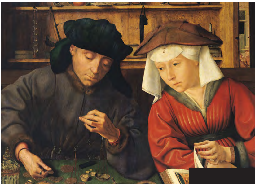
Tavlan hänger idag på Louvren i Paris.

1500-talets Antwerpen. Marknaden i staden är ett finansiellt centrum med ett namn av handel, råmateriel och exotiska produkter. Medeltiden är på väg mot sitt slut med renässansen väntande runt hörnet. Konstnären Quinten Massys arbetar mitt i centrum och målar 1514 ett konstverk som senare anses vara ett mästerverk från den flamländska renässansen. Men vad föreställer tavlan? Och vad berättar den om staden, landet och upptäcksresor i en historisk kontext?